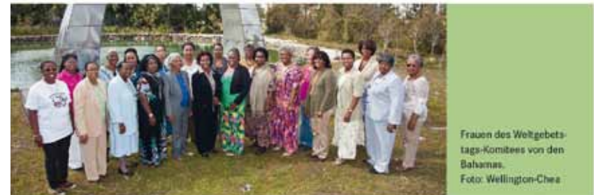
Frauen des Weltgebets- tags-Komitees von den Bahamas.

Gottesdienst zum Weltgebetstag Freitag, den 6. März 2015 Gemeindehaus, Kahlertstraße 26