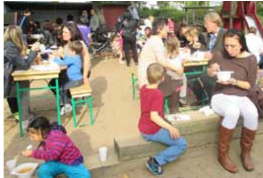
Die Gemüsesuppe, zubereitet aus den Erntegaben, schmeckte groß und klein.

Der Wald verwandelt sich langsam in ein goldenes Blättermeer und die Tage werden merklich kürzer und kühler: Der Herbst ist da! Nicht aus dem Herbst wegzudenken ist das Erntedankfest.