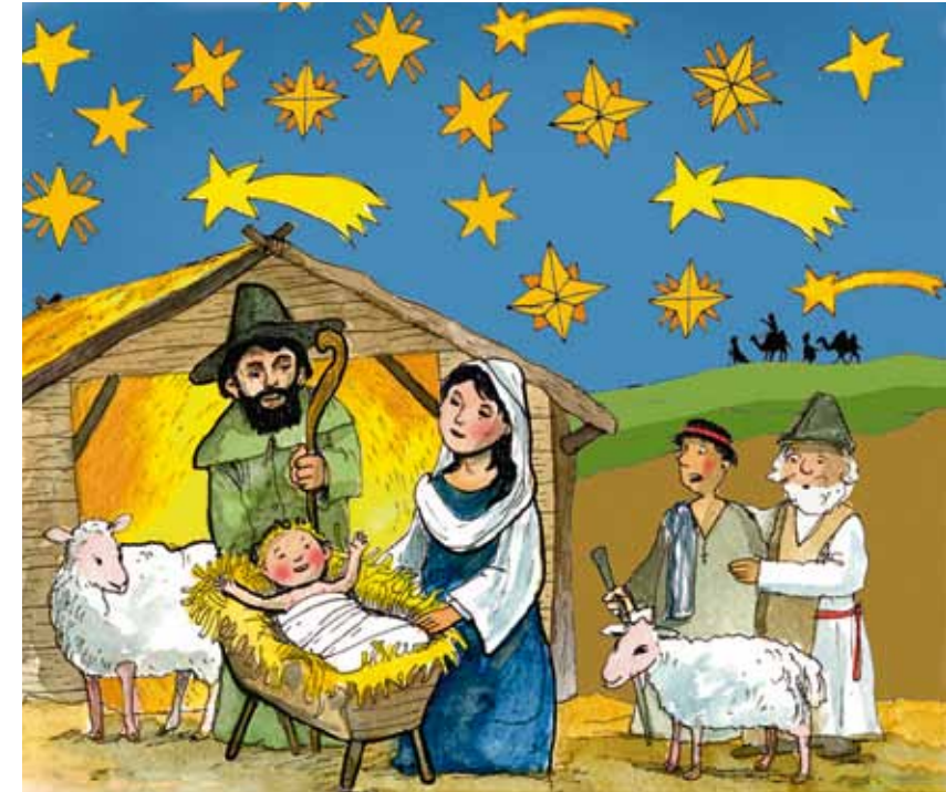
Lösung: Der 2. Stern von rechts oben