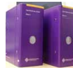
Die Rechtsammlung der EKHN.

Gemäß der neuen Kirchengemeindeordnung (KGO) wurde der Kirchenvorstand verpflichtet, eine Geschäftsordnung zu erstellen. Sie soll die wichtigsten Regelungen für den Kirchenvorstand zusammenfassen. In einem Anschreiben an den Kirchenvorstand steht folgendes Ziel: „Mit einer Geschäftsordnung soll die Aufgabenwahrnehmung nach innen und außen transparent gemacht werden.“ In einer Geschäftsordnung wird nichts Neues beschrieben, was nicht auch schon im Kirchenrecht der EKHN aufgeführt ist. Warum also eine zusätzliche Ordnung?