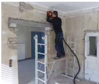
Rohbauarbeiten in den zukünftigen Büroräumen im ersten Stock des Gemeindehauses.

Die Umbauarbeiten im Gemeindehaus haben Mitte Februar begonnen. Im Obergeschoss sind die Rohbauarbeiten bereits abgeschlossen. Ein Teil der dortigen Wandarbeiten (Verputzen, Tapezieren, Streichen) erfolgt in Eigenleistung. Hierzu werden noch dringend Helfer gesucht. Wenn Sie uns hierbei unterstützen können, wenden Sie sich bitte an Karl Thöne (061 51 – 2 21 35).