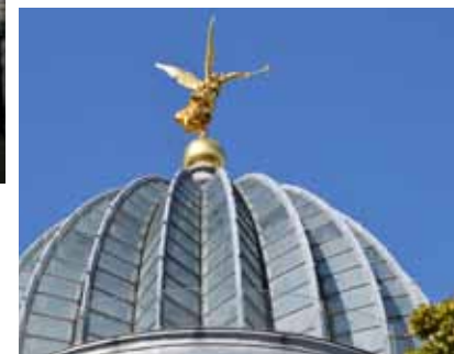
unten: Kuppel der Kunstakademie ("Zitronenpresse")