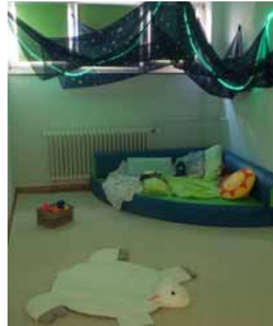
Die neue "Ruheinsel" für die Kinder.

Ebenso wie wir sind auch unsere Kinder dem Druck der Zeit ausgesetzt. Umso wichtiger ist es also, Ruheinseln zu schaffen, auf die man sich zurückziehen kann. In der Kindertagesstätte Wittenberg-Haus ist gerade eine solche Insel entstanden. Da die Zeitspanne, die die Kinder in unserer Einrichtung verbringen, stetig größer wird, suchen sie im Laufe des Tages immer wieder eine Rückzugsmöglichkeit aus dem Trubel des Gruppengeschehens. Genau dazu lädt nun unser „Snoozleraum“ ein.