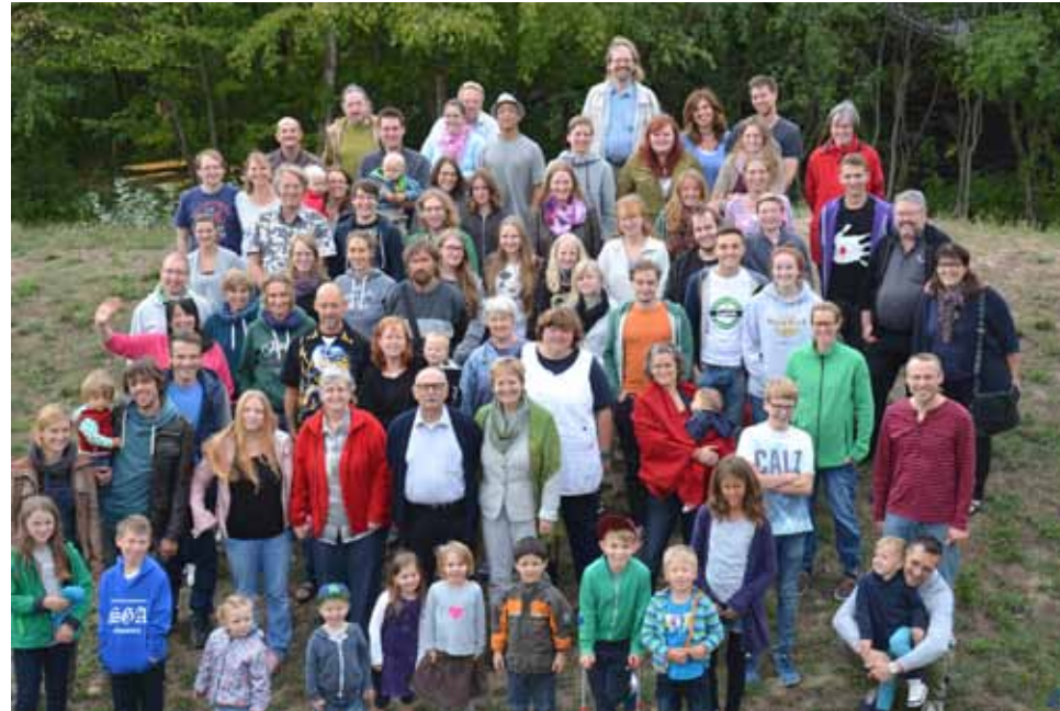
Bunt gemischt, von Jung bis Alt: die Teilnehmer der Gemeindefreizeit 2015.

ten Abend“ mit Spielen, bei dem der Teamgeist und die Gemeinschaft im Vordergrund standen. Klein und Groß konnten dabei in unterschiedlichen Wettstreiten Punkte sammeln – wenngleich der Preis für alle am Ende derselbe war (frei nach dem Motto: dabei sein