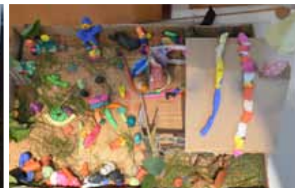
oben: Ein Ergebnis der Kleingruppenarbeit "Gemeinde als Organismus" unten: So bunt stellen sich die Kinder Gemeinde vor ...

Gemeindefreizeit 2016 08. - 10. Juli 2016 in Gernsheim