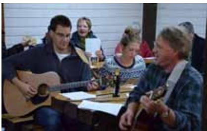
v.oben nach unten: Abenteuer beim Geocaching, Begegnungen beim Kaffeetrinken, Spaß am "Schlager-Feuer"

PS: Einen großen Dank an alle, die sich in die Gemeinschaft auch durch ihre Mitarbeit eingebracht haben und so die Gemeindefreizeit erst möglich gemacht haben. DANKE! KT