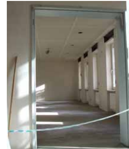
Bald ist der neue, helle Seminarraum fertig - die Ausstattung muss jedoch noch finanziert werden.

Die Einrichtung des neuen Seminarraums steht noch aus. Die Gemeindeleitung plant, neue Möbel zu beschaffen - nicht nur für den neuen Raum, sondern genauso für Gemeindefestsaal und Gartenzimmer. Dazu sind aus früheren Spendenaktionen