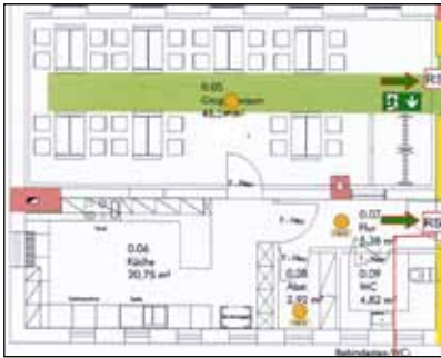
Grundriss des neu gestalteten Osttrakts des Gemeindehauses.

Im Juli war mit Abbrucharbeiten im Erdgeschoss des Gemeindehauses der zweite Bauabschnitt angelaufen. Wir hatten im letzten Gemeindebrief davon berichtet. Jetzt ist auch das Erdgeschoss nahezu fertig gestellt.