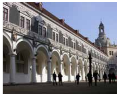
links: Stallhof mit Kuppel der Frauenkirche