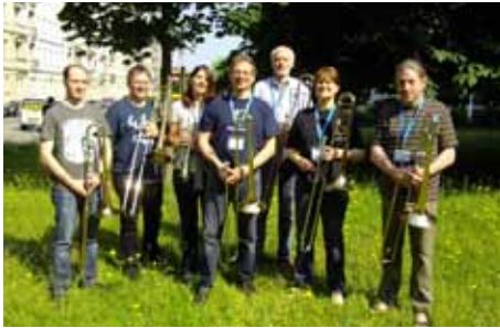
Die Bläser aus Darmstadt, hier nach dem Morgenblasen am Sonntag ...