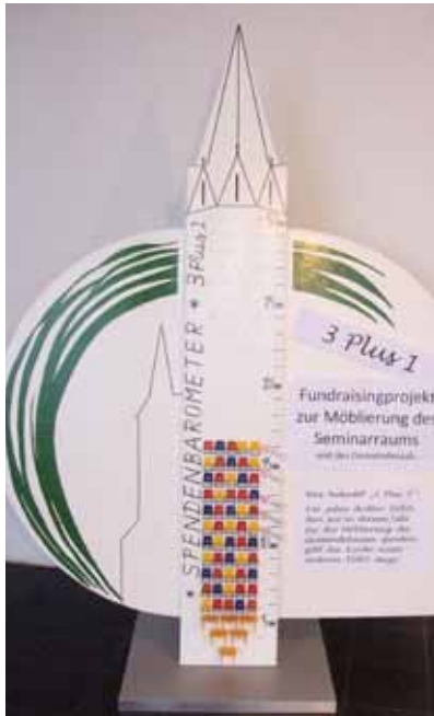
Das Spendenbarometer in der Johanneskirche informiert über den aktuellen Stand der Spendenaktion.

Sie werden sich erinnern: In den letzten beiden Gemeindebriefen hatten wir Ihnen die Notwendigkeit von neuen Möbeln im Gemeindehaus geschildert. Vorrangig soll der beim letztjährigen Umbau neu geschaffene Seminarraum eingerichtet werden, wofür wir 12 Tausend Euro kalkuliert hatten. Dann sollen auch die verschlissenen Stühle im Gemeindesaal ersetzt