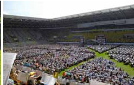
... waren auch in diesem Chor zum Abschlussgottesdienst dabei.

"Luft nach oben" war das Motto des Deutschen Evangelischen Posaumentags, zu dem rund 17.500 Bläser und Bläserinnen aus verschiedenen evang. Landes- und Freikirchen sowie aus zahlreichen Ländern von Argentinien bis Südafrika vom 3. bis 5. Juni nach Dresden kamen – mit dabei auch sechs Bläser aus dem Bläserkreis der Johannesgemeinde mit einer Verstärkung aus der Baptistengemeinde Ahastraße.