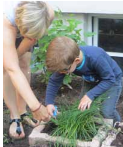
Unter tatkräftiger Mithilfe von Eltern, Erzieher/Innen und Kindern entstand im Hof ein Obst- und Gemüsegarten