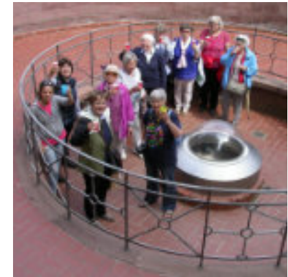
Bild oben: Ausflug nach Basel, 2013; unten: Ausflug nach Bad Homburg, 2019

Einige Frauen der „ersten Stunde“ leben nicht mehr oder sind aus Altersgründen nicht mehr in der Lage zu kommen. Aber die Gruppe hat sich immer wieder „aufgefüllt“ und ist nach wie vor aktiv: Die Ideen reichen bereits in das kommende Jahr hinein.