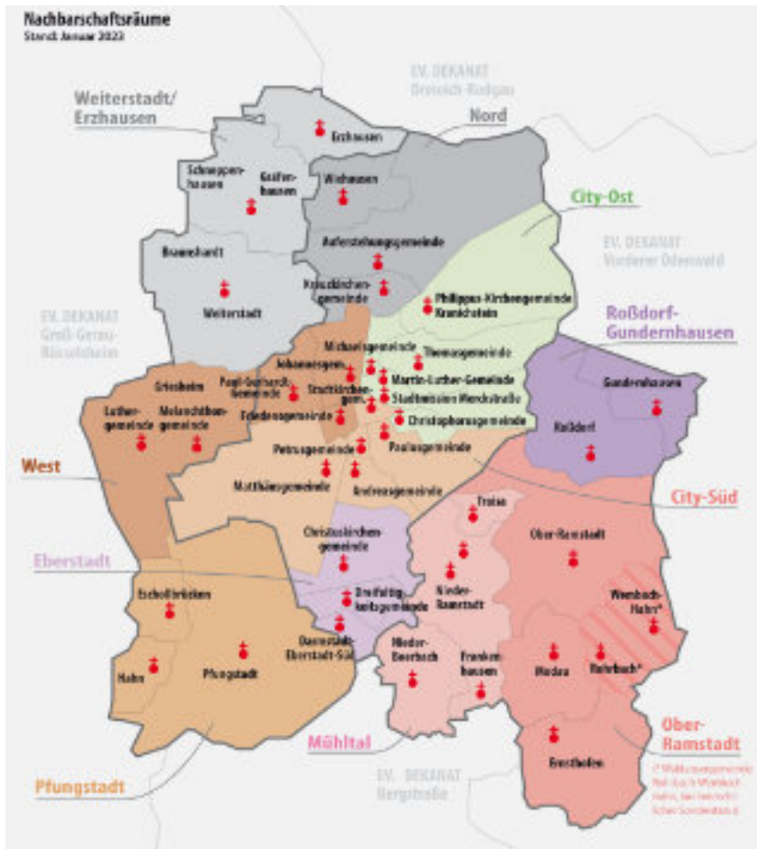
Die Karte zeigt Vorschläge für die Nachbarschaftsräume von Darmstadt und Umgebung. Eine Beschlussfassung durch die Synode stand bei Redaktionsschluss noch aus.

mitglieder im Rahmen eines „Sommerfests mit Arbeitscharakter“ geplant. Da wird dann über Entwicklungspotentiale zu reden sein: Wohin kann, wohin soll sich unser möglicher Nachbarschaftsraum entwickeln? Was soll, was kann bleiben wie es ist? Was kann bzw. was könnte sich wie verändern? Wir halten Sie auf dem Laufenden. DGS