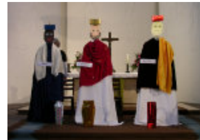
Gottesdienstaktion, Heilige drei Könige im Jahr 2010