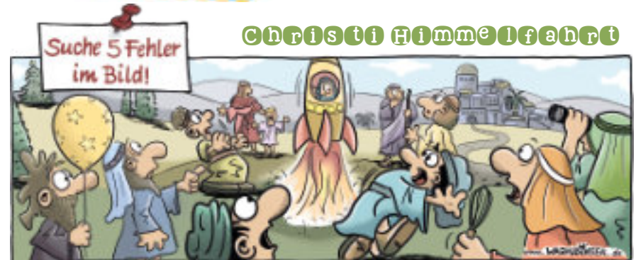
Weihnachtsbaum, Luftballon, Rakete, Schneebesen, Fernglas